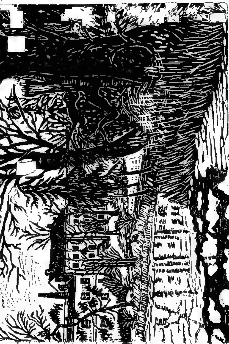
TRU botanikens, Linnöföjge